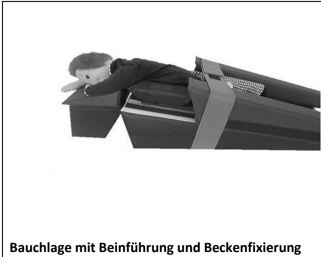
Bauchlage mit Beinführung und Beckenfixierung