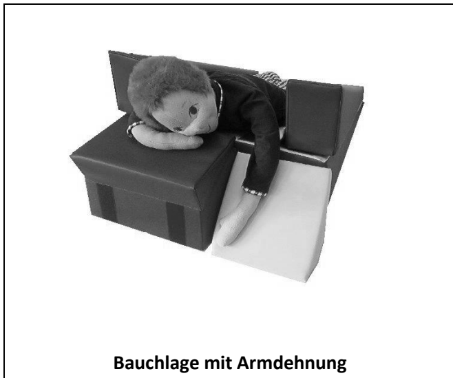
Bauchlage mit Armdehnung