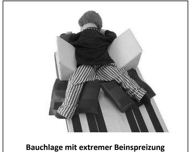
Bauchlage mit extremer Beinspreizung