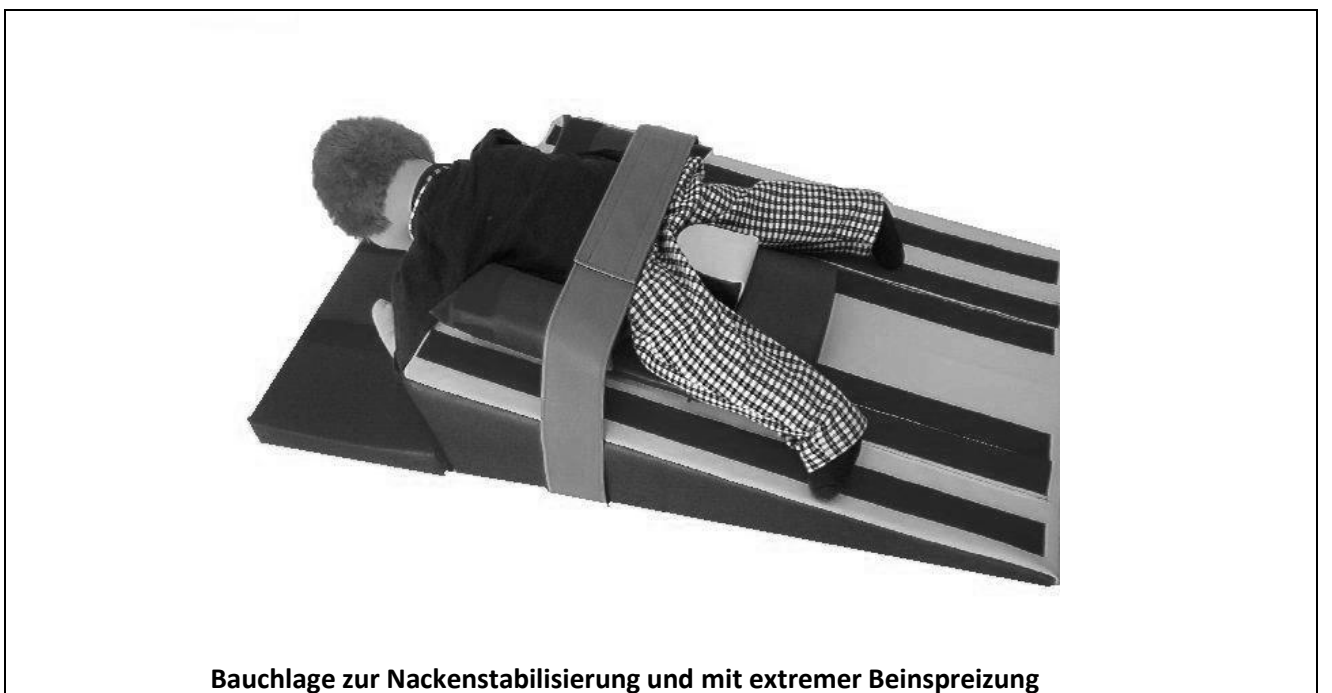
Bauchlage zur Nackenstabilisierung und mit extremer Beinspreizung