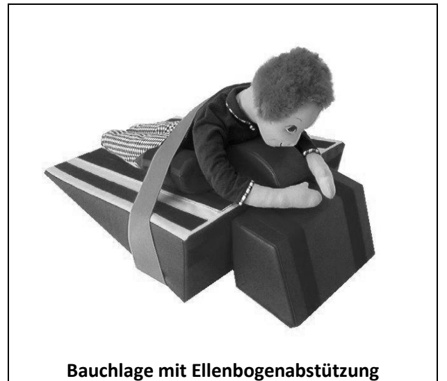
Bauchlage mit Ellenbogenabstützung