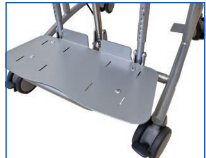
Fußbank, höhenverstellbar und hochklappbar