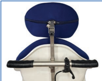
Kopfstütze, Schiebegriff und Handauslöser für Neigungsverstellung