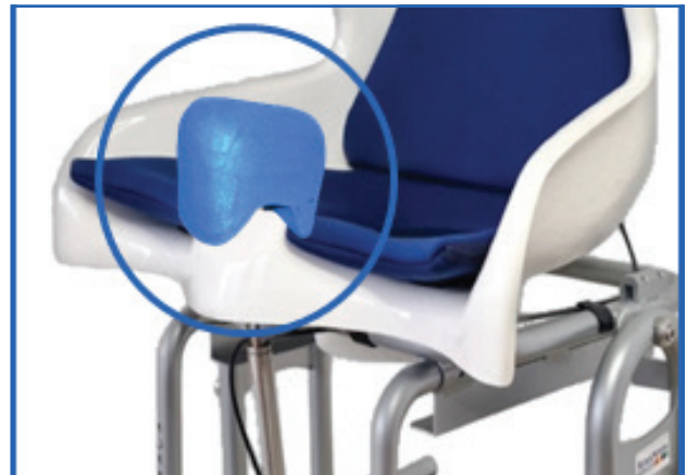
Abduktionskeil steckbar als integrierter Spritzschutz