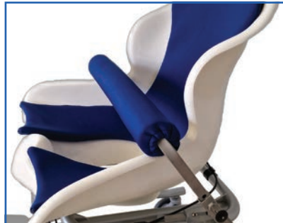
Sicherheitsbügel, Sitz- und Rückenpolster