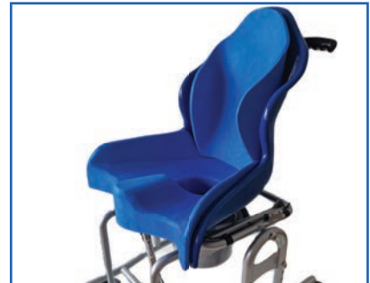
Ausschnittsverkleinerer und Rückenpolster mit Seitenführung aus geschlossenporigem Schaumstoff