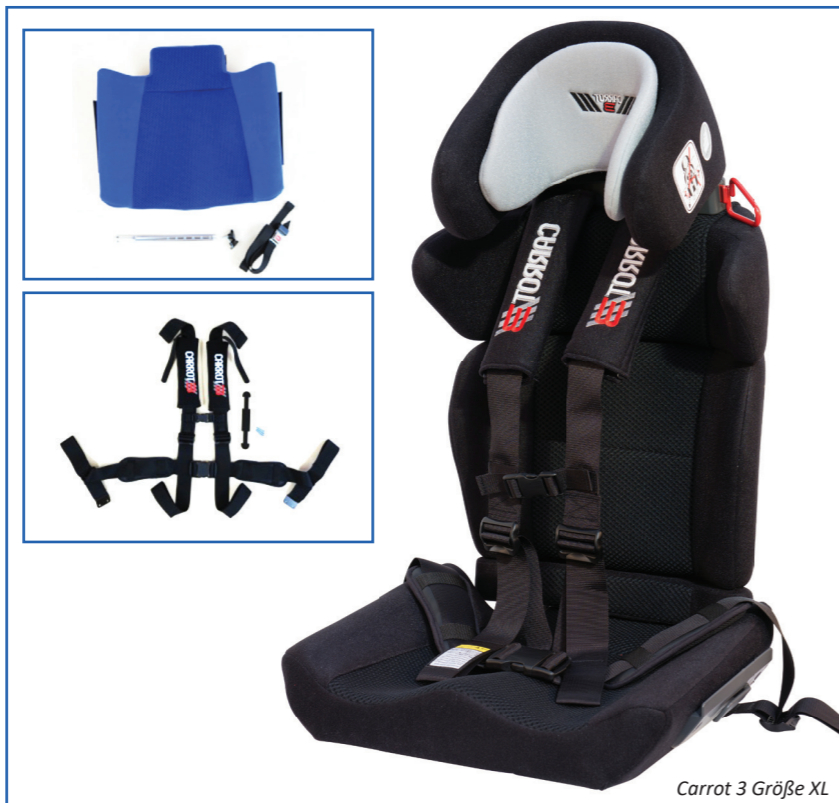
Carrot 3 Größe XL