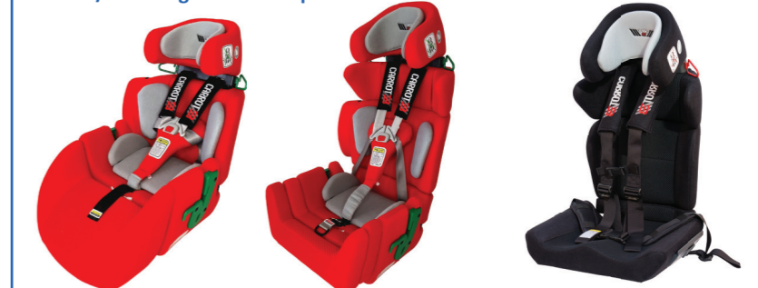
bis ca. 100-120 cm